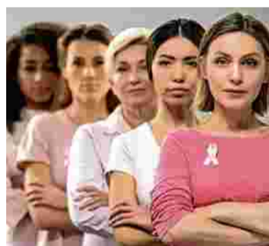
Brustkrebs trifft jede achte Frau.